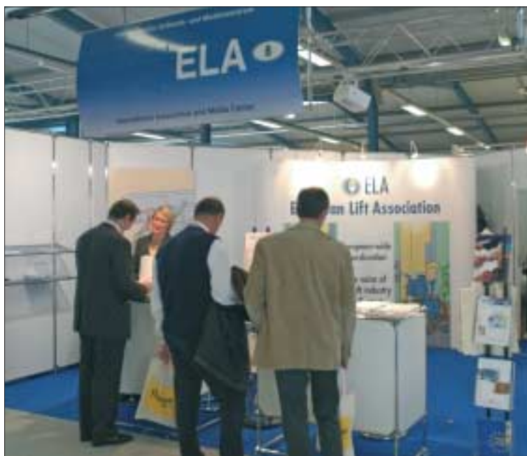
Stella Bedeur, sur le stand ELA, avec des visiteurs intéressés par la brochure et le CD-Rom sur les pictogrammes du secteur de l'ascenseur

Les halls de la foire d'Augsbourg étaient bondés entre le 18 et le 21 octobre 2005. C'est la première fois que le salon de l'ascenseur, INTERLIFT, utilisait l'ensemble des sept palais mis à sa disposition.