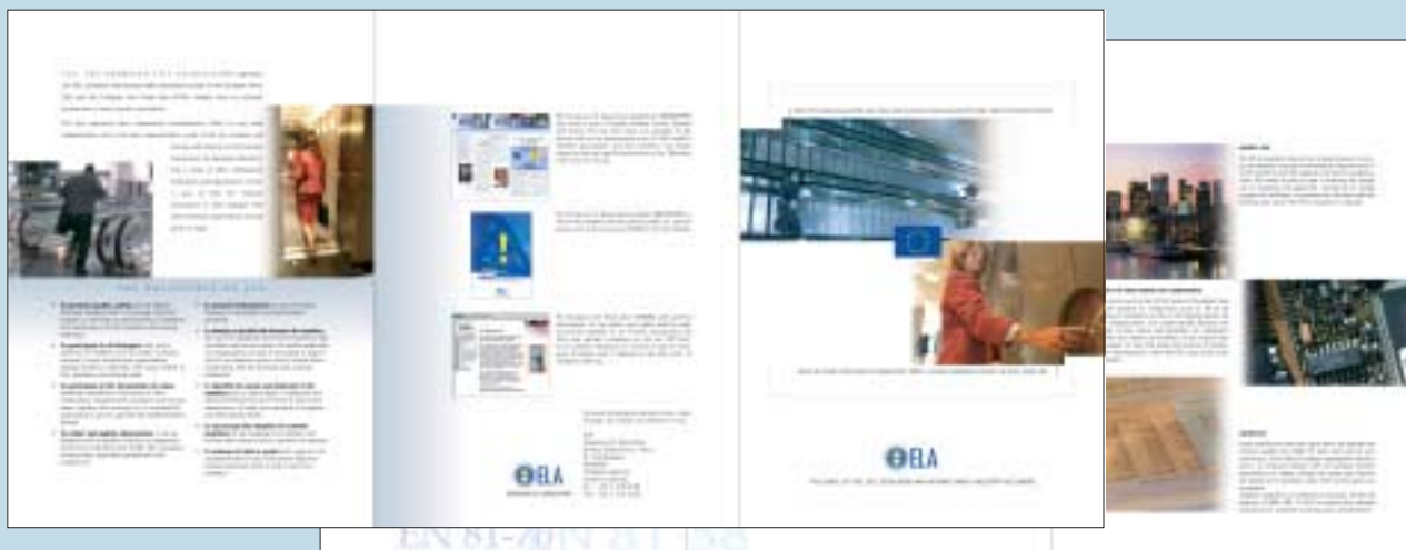
Les nouvelles brochures ELA et le CD-Rom

ELA a publié deux nouveaux documents : une plaquette de présentation générale, dont nous avons grand besoin et une mise à jour de la brochure "Signs" consacrée à tous les pictogrammes du monde de l'ascenseur et de l'escalator. La brochure était épuisée. ELA a également pris l'initiative de produire un CD-Rom contenant tous les pictogrammes en question, et cela en deux formats différents : l'un qui est réservé aux graphistes professionnels et permet l'impression en toutes grandeurs ; et l'autre qui peut être utilisé par tout un chacun sur son PC, pour des présentations powerpoint ou d'autres applications à basse résolution. Le prix de la brochure est de 20 € (15€ pour les membres). Le CD-Rom coûte 45€ (40€ pour les membres). L'ensemble (brochure + CD-Rom) est vendu au prix promotionnel de 60€ (50€ pour les membres) + frais d'envoi.