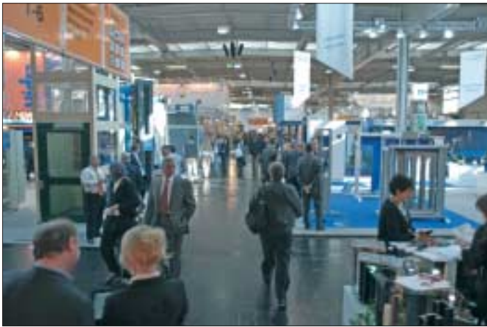
I padiglioni di Asburgo erano più affollati che mai in questa edizione di Interlift