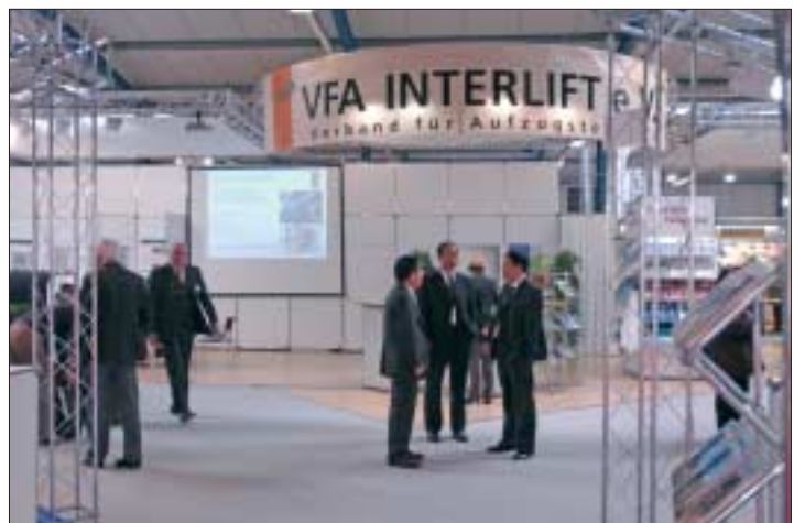
VFA, organizzatore dell'esposizione si dichiara soddisfatto dell'edizione 2005