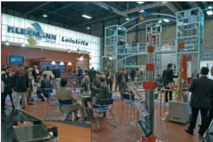
La società greca Kleemann presente ad Interlift con un grande stand