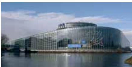
El Parlamento Europeo en Estrasburgo

La iniciativa Build-for-All de la Comisión Europea ha terminado su primera tarea, la más importante: la elaboración del "manual de referencia", un verdadero juego de herramientas para los procedimientos del