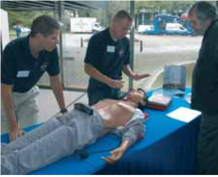
Durante el descanso, el equipo de formación de GUEST expone la técnica de desfibrilación que puede salvar vidas en caso de emergencia y que ahora puede ser empleada en Europa por personal no-médico tras recibir la formación adecuada.

evacuar a los ocupantes en caso de incendio en un rascacielos. Dichas soluciones implican la construcción de plantas rescate resistentes (una cada 15 ó 20 plantas o una por cada zona de ascensores) desde las que se evacuarán a los ocupantes a través de ascensores "bote salvavidas" siguiendo procedimientos especiales. Cámaras CCTC y sensores permitirán supervisar permanentemente el estado de la sala de máquinas y de los conductos de los ascensores durante las operaciones de evacuación.